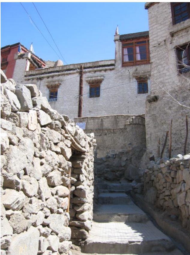
Weg zu unserem Haus Way to our house