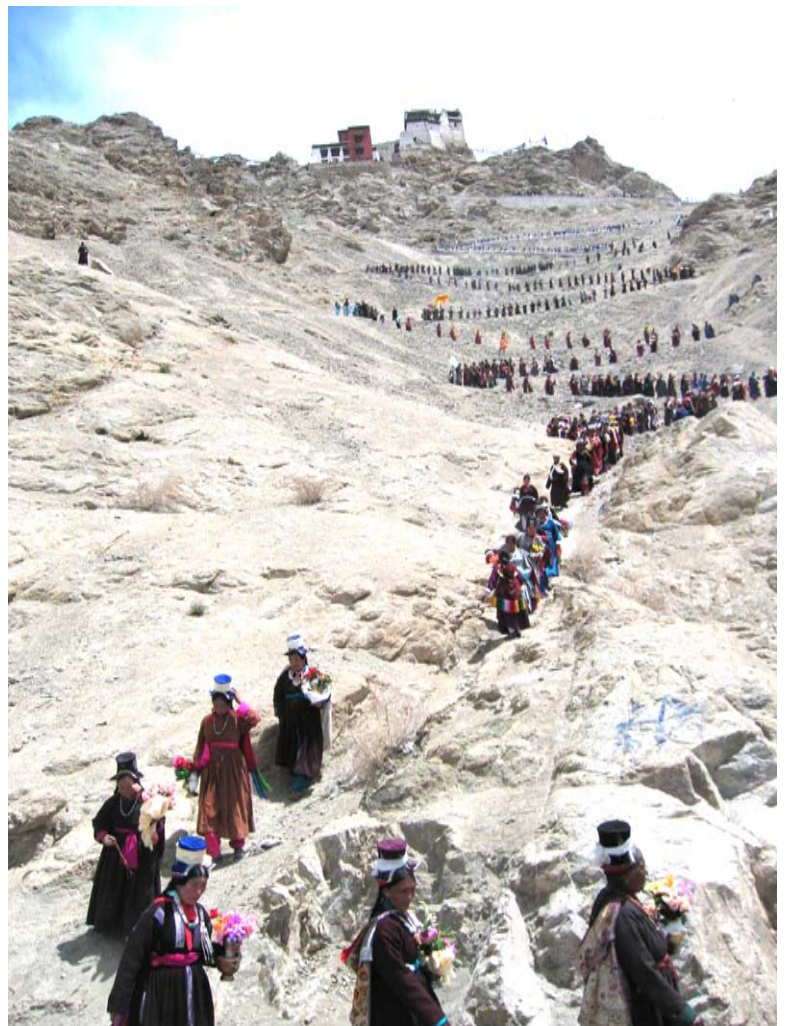
Holiday in Leh - Sakadawa, commemorating Buddha's birth, enlightenment and Parinirvana