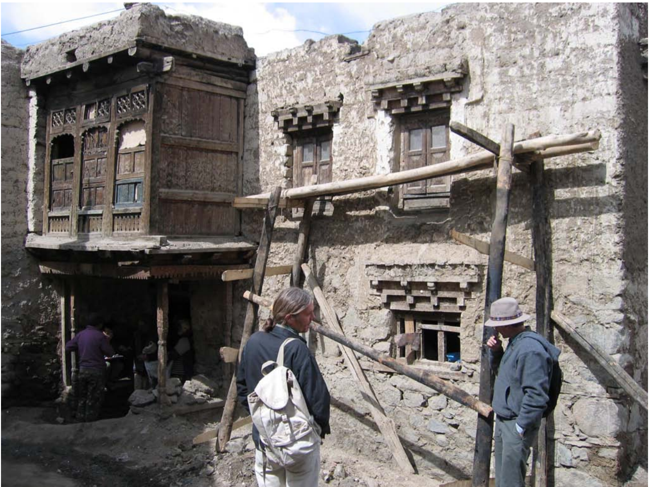
Arbeit - Restaurierung des Sofi Hauses Work - Restoration of Sofi House