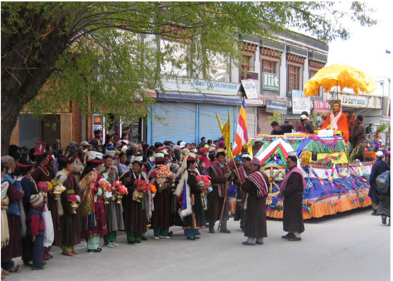
Feiertag in Leh - Sakadawa, Gedenken an Buddha's Geburt, Erleuchtung und Eingehen ins Nirvana