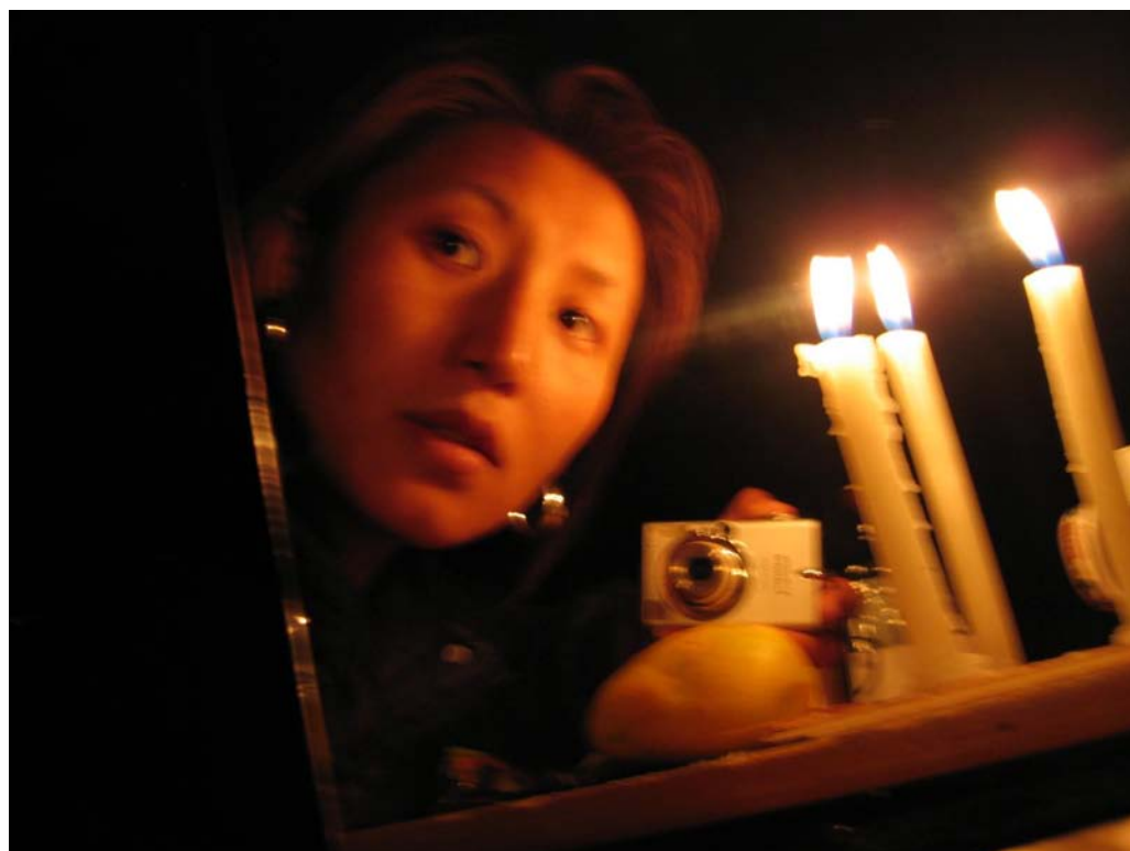
Mango essen Mango eating