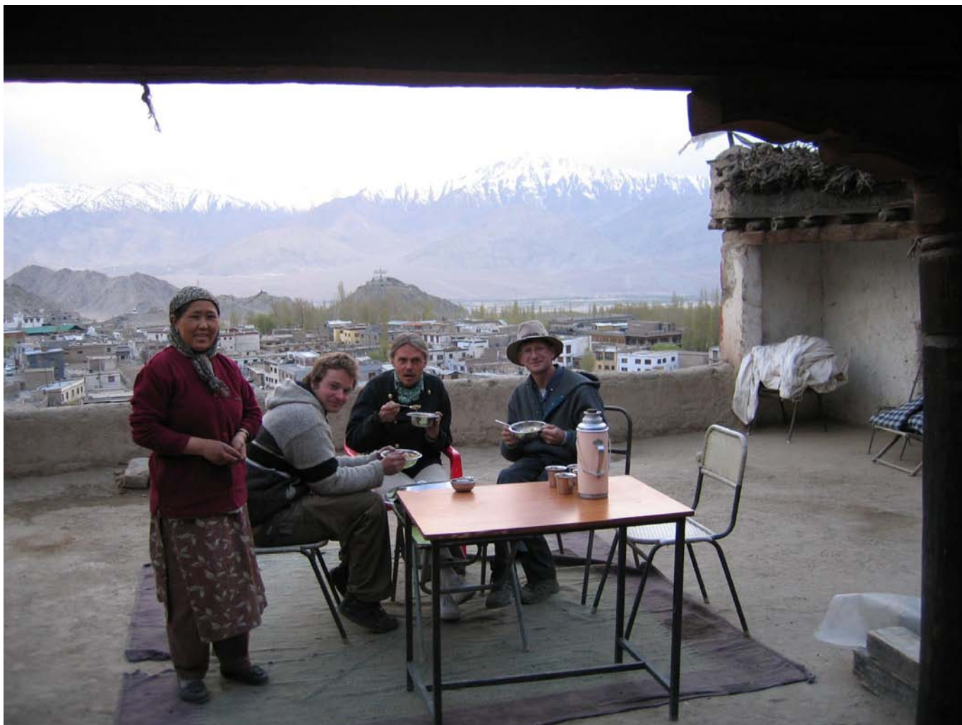
Mittagessen auf der Terrasse